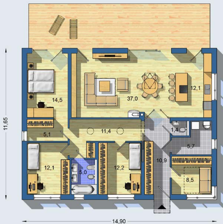
PRÍZEMIE [celková plocha 136.7 m 2 ]

Návrh dispozície pôdorysu rodinného domu je architektonickým dielom podľa § 3 ods. 6 Autorského zákona č. 185/2015 zb. Jeho porušenie je trestné podľa § 283 Trestného zákona.