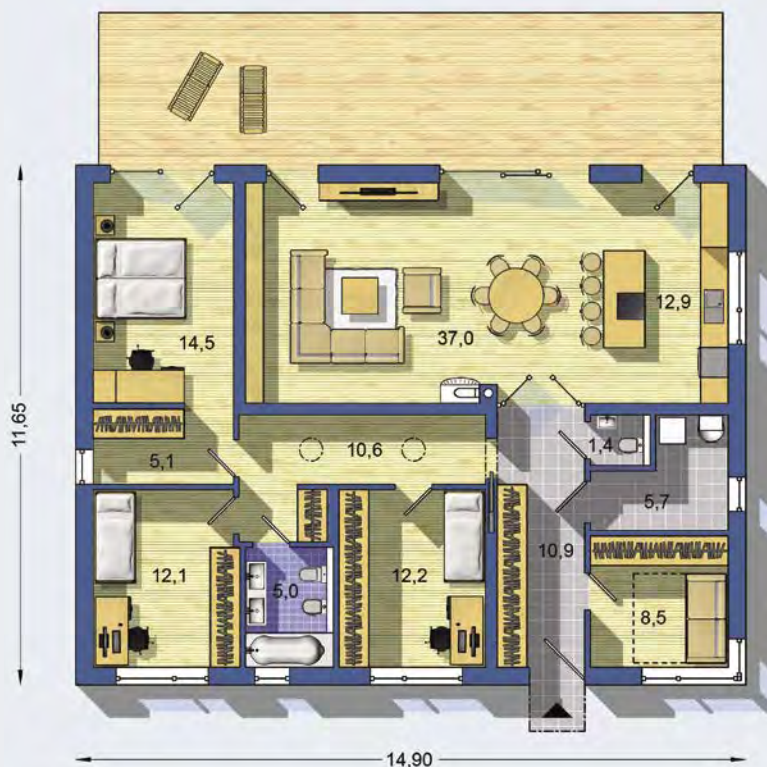
PRÍZEMIE [celková plocha 136.7 m 2 ]

Návrh dispozície pôdorysu rodinného domu je architektonickým dielom podľa § 3 ods. 6 Autorského zákona č. 185/2015 zb. Jeho porušenie je trestné podľa § 283 Trestného zákona.