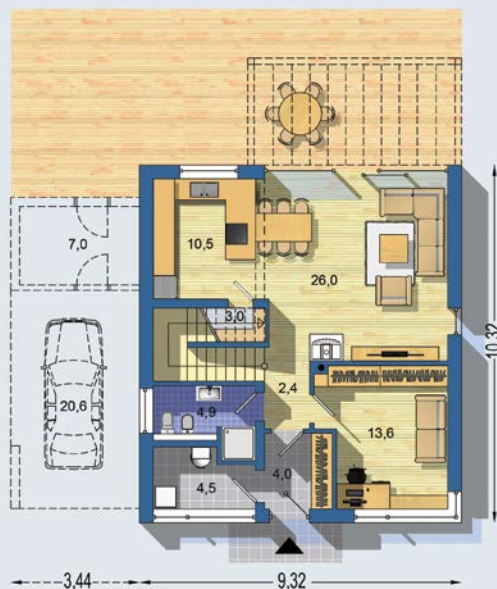
PRÍZEMIE [celková plocha 74.9 m 2 ]