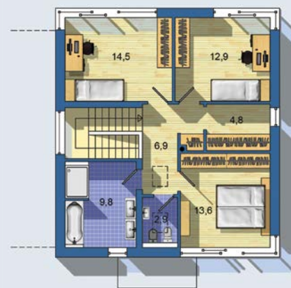
POSCHODIE [celková plocha 65.3 m 2 ]

Spôsob vykurovania: podlahové vykurovanie Predpokladané náklady na vykurovanie pre zdroj: tepelné čerpadlo 12 €/mesiac plynový kotel 19 €/mesiac