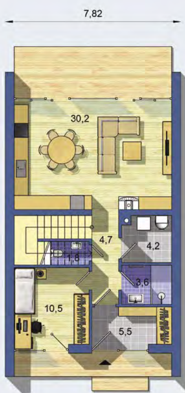
PRÍZEMIE [celková plocha 60.4 m 2 ]

Všetky ceny sú s DPH Aktuálne akciové ceny a zľavy sú na www.EurolineSlovakia.sk